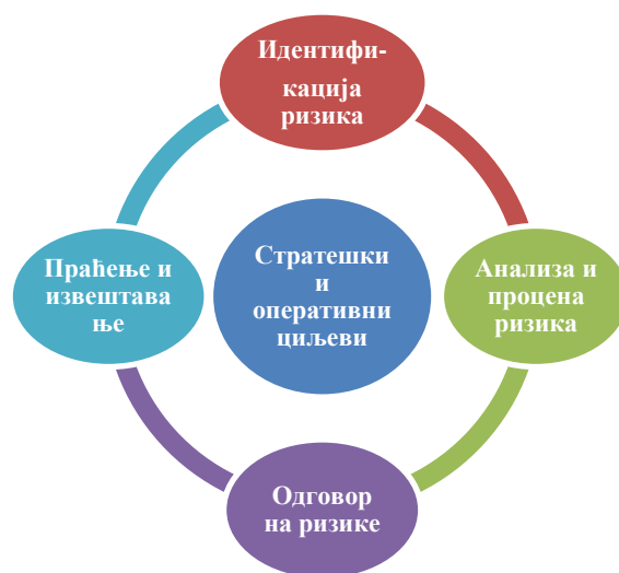
Слика 1. Процес управљања ризицима

Процес управљања ризицима састоји из четири основна корака која се примењују и на стратешке и на оперативне ризике: 1) идентификација ризика; 2) анализа и процена ризика; 3) одговор на ризике; и 4) праћење и извештавање.